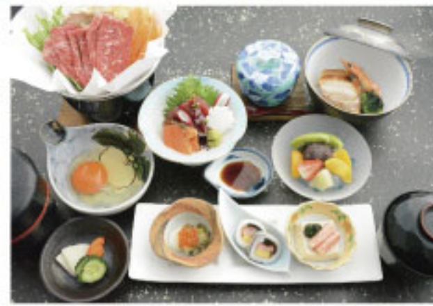
《レギュラープラン和食膳》