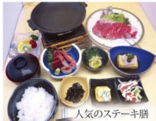
人気のステーキ膳