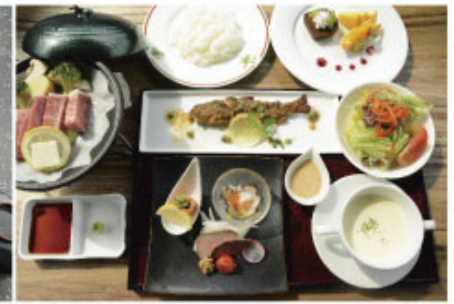
《レギュラープラン洋食膳》