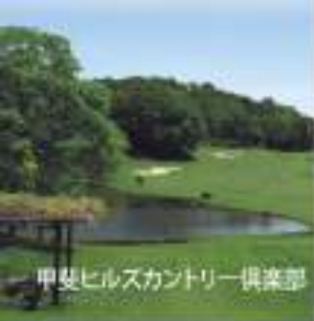
甲斐ヒルズカントリー倶楽部