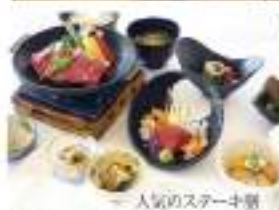
人気のステーキ朝食