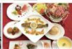
和風朝飯レギュラー