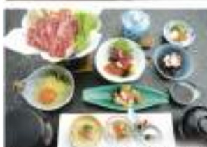
和風朝飯レギュラー