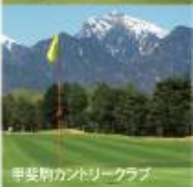
甲斐駒カントリークラブ