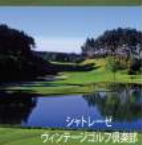
シャトレゼ ウィンテージゴルフ倶楽部