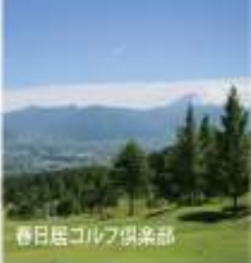
春日居ゴルフ倶楽部