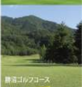
勝沼ゴルフコース