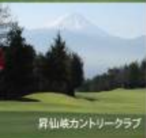
昇仙峡カントリークラブ